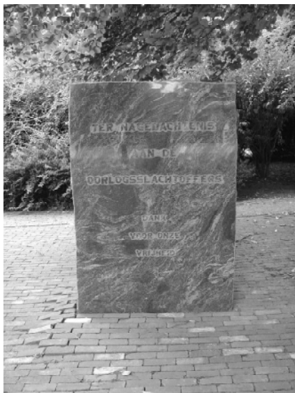
Herdenkingsmonument aan de Vrijheidslaan te Valthermond

Denken we aan alles wat er is gebeurd. We herdenken de doden en slachtoffers van zovele andere onlusten en of oorlogen.